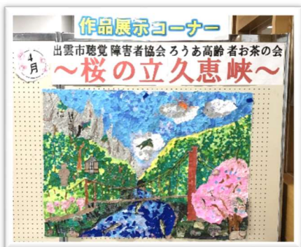
4月 「桜の立久恵峡」 出雲市聴覚障害者協会 ろうあ高齢者お茶の会