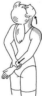
首を逆方向に少し傾けて 首筋、肩周辺の筋をのばす。