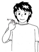
うちわであおぐように する。