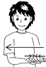
両手のひらを下に向け、 繰り返して左から右へ動かす。