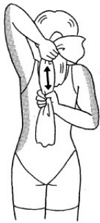
肘を真上に向けて肩周辺と 体側の筋をのばす。

(※「手話通訳者のためのリラクゼーションテキスト」に掲載されているイラストを一般社団法人全国手話通訳問題研究会に許可を得て掲載しています。)